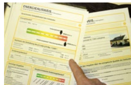
Im Energieausweis zeigt sich, wie gut die Heizung geplant wurde.

Moderne Anlagentechnik bietet erhebliche Effizienzpotenziale. Dies gilt sowohl für die mit fossilen Energieträgern (Erdgas, Öl) betriebene Brennwerttechnik als auch für die umweltfreundliche Wärmeerzeugung mit regenerativen Energieträgern (z. B. Sonne, Biomasse, Erdwärme, Luft). Regenerative Energieanlagen sind heute Stand der Technik und können wirtschaftlich betrieben werden. Dies gilt insbesondere auch für den Einsatz von Kraft-Wärme-Kopplung durch Blockheizkraftwerke (BHKWs). Mini- und Mikro-BHKWs können sinnvoll und effizient auch für kleinere Einheiten eingesetzt werden.