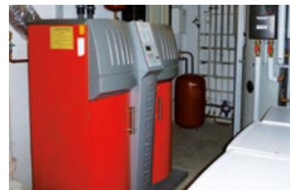
Heizzentrale mit Holzpelletkessel